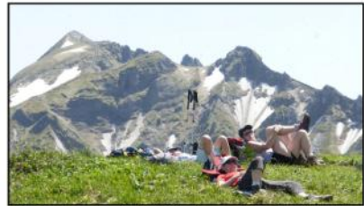
Puy de Sancy (1885m) - Puy Redon (1781m) - Tour Carrée (1746m)

Le soir même, mise en œuvre de la nouvelle activité initiée en ce mois de juin 2014 par la Grimpe : la cuisine (un logo