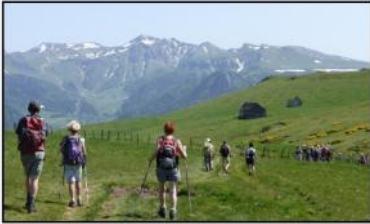
Face au Puy de Sancy (1885m), Bretons sous le Puy Gros

Barbier, du Monne, de la Vache, 8 heures de marche pour 1000 m de dénivelé et tous ont dû affronter sur les cimes une offensive bruyante et invasive de nuées de moucheron. Enfin les VTTistes ont exécuté un grand huit depuis le gîte, une première boucle avant de descendre à la Bourboule, puis remontée par un