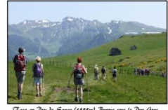
Traces au Pic de Sauses (1883m). Retrouvés sous le Pic d'Orre