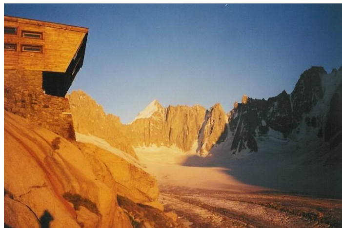
Figure 1 : Refuge et Glacier d'Argentière

La course d'application le dimanche permet de mettre en pratique ces différentes techniques.