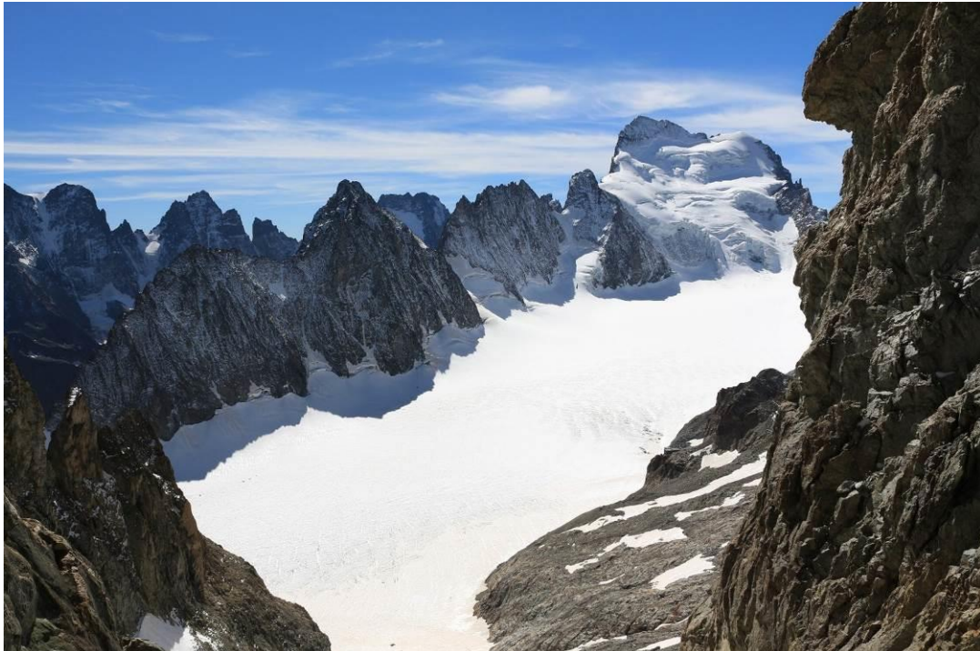
Figure 3 : La Barre et le Dôme de Neige des Ecrins

Il est nécessaire d'avoir déjà réalisé l'école de glace, cette année ou précédemment.